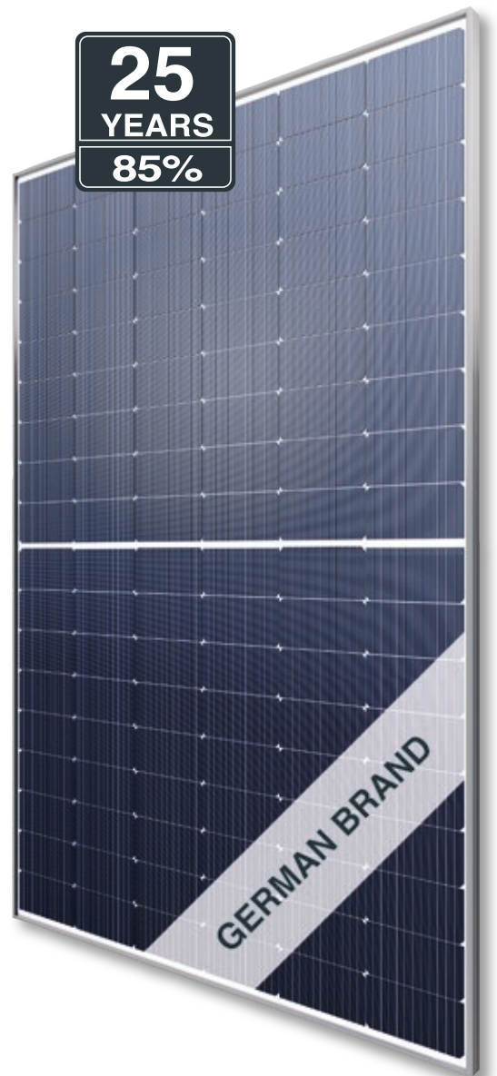
Abb. ähnlich 108MHDE210225A

Exklusive lineare AXITEC Höchstleistungs-Garantie!