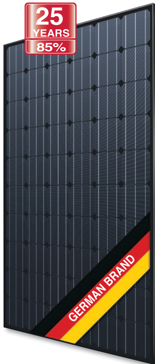
Abb. ähnlich 60M156DE161116A