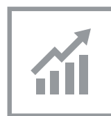
Anlageoptimierung, höhere Erträge