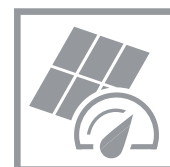
Hohe Effizienz für zuverlässige Erträge