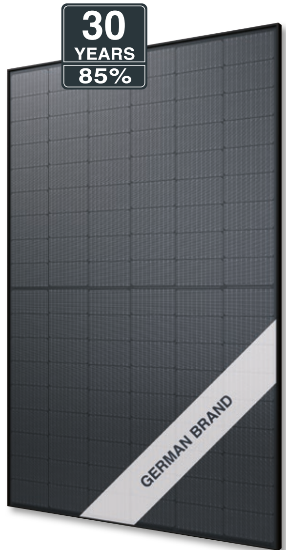
Abb. ähnlich 108MGDE220829A