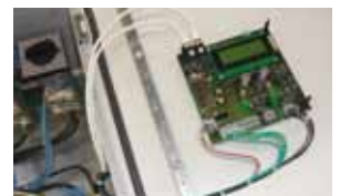
Detailansicht der Control- lerplatine auf der Innen- seite der Gehäuseuntere